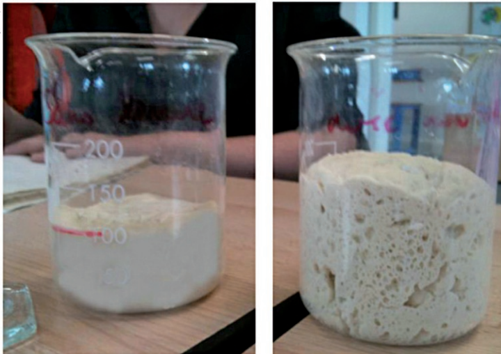
Préparation sans levure